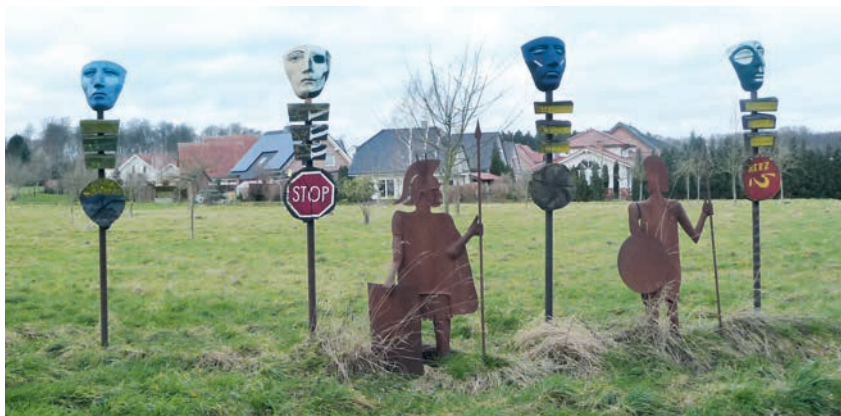
Leben und Wohnen in idyllischer Umgebung, Arbeitsplätze vor Ort, Freizeitaktivitäten inklusive!

Unter dem Motto „Gemeinschaft Zukunft geben“ startet die Dorfregion Ostercappeln – Schwagstorf